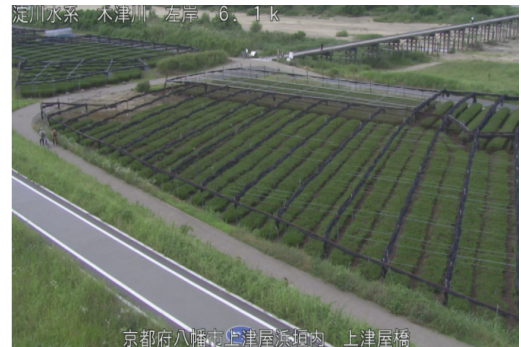
Sample view at Kouzuyabashi

There are cameras placed at nearby rivers in Joyo. You can check water levels during heavy rain using these cameras so please use them to help prepare for evacuation in the event of an emergency. The views can also be enjoyed during non-emergencies. Please be aware that some cameras do not operate well at night.