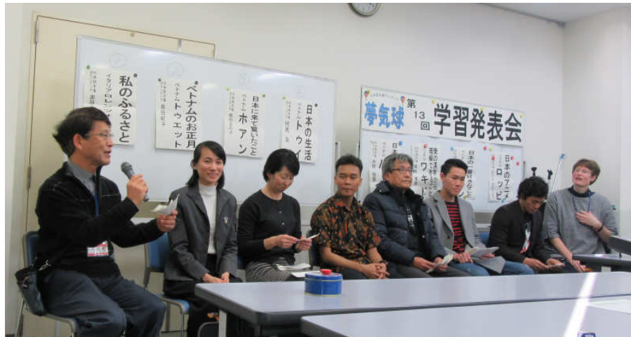
参加者からの質問に答える発表者と支援者