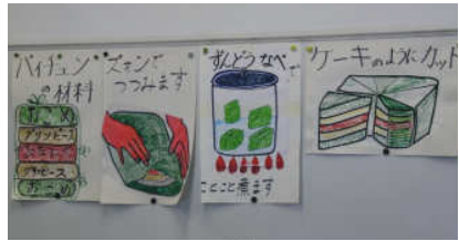
ベトナム料理「バイチュン」の説明

その猛勉強の中、息抜きとなったのが、雑談です。特に盛り上がったのは、おたがいの国の見知らぬ料理の説明。実は、二人にはおしゃべりなところは勿論、料理をする事とそれを食べる事が大好き、という共通点がありました。そんな二人ですから、発表の原稿内で説明する、ベトナムのちまき、「バイチュン」の説明は大切です。補足として、バイチ