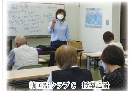
韓国語クラブC 授業風景