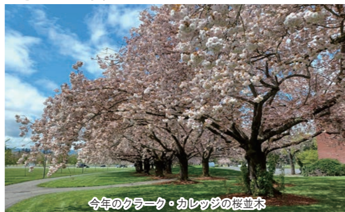
今年のクラーク・カレッジの桜並木

現地の方からも早く対面でお会いしたいとの声をいただき、城陽からの訪問団派遣も早く計画できると考えています。