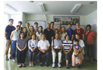
2017 年のホストファミリー