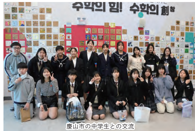
慶山市の中学生との交流

帰路のソウルでは、Nソウルタワー、韓服を着て韓国を代表する古宮・景福宮の見学、明洞や仁寺洞の散策など韓