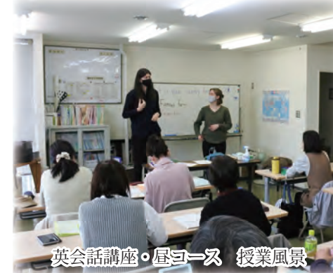
英会話講座・昼コース 授業風景