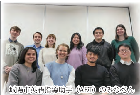
城陽市英語指導助手 (AET) のみなさん