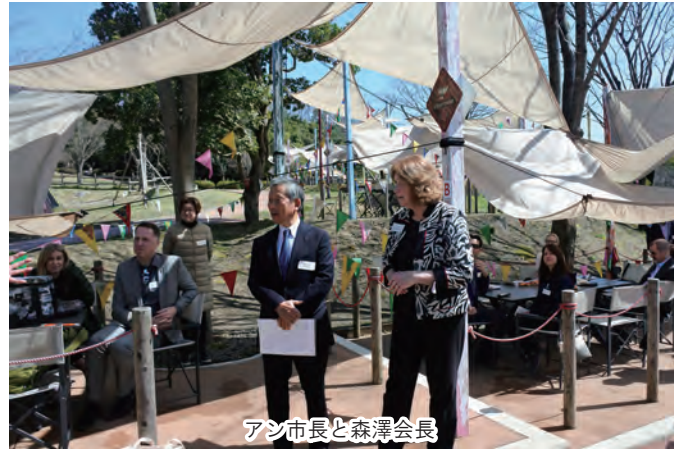
アシ市長と森澤会長

姉妹都市米国ワシントン州バンクーバー市から訪問団 31 名が 2023 年 3 月 13 日（月）～ 17 日（金）の期間で来訪されました。