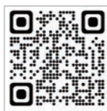
多言語版も市HPからダウンロードできます。

また、分別についても少しルールが変更となったので、現在「家庭ごみ分別表」も3言語で作成中です。