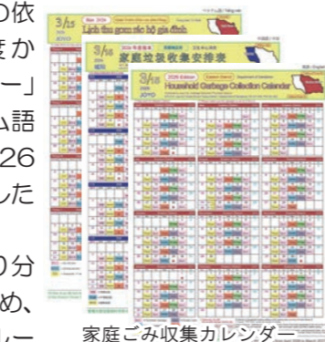
家庭ごみ収集カレンダー

また、分別についても少しルールが変更となったので、現在「家庭ごみ分別表」も3言語で作成中です。