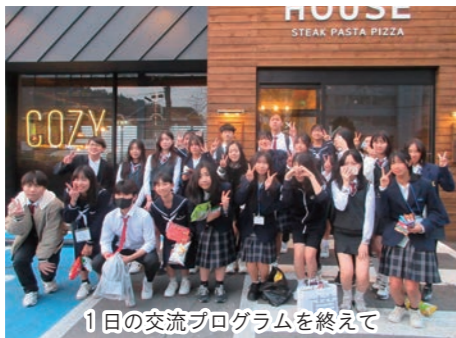
1日の交流プログラムを終えて

派遣の一番の目的は中学生同士の交流です。2日目に慶山市の新上中学校を訪問しました。学校到着からたくさんの生徒の出迎えを受け、歓迎式、コチュジャン作り、給食体験、城陽公園見学、文化施設見学、夕食会などを通して、お互いを知り、友情を深める貴重な経験となりました。